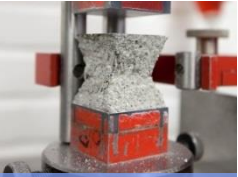
Betong och sten