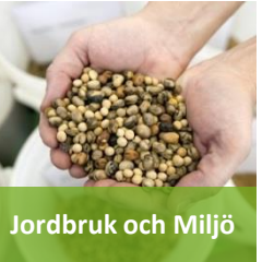
Jordbruk och Miljö