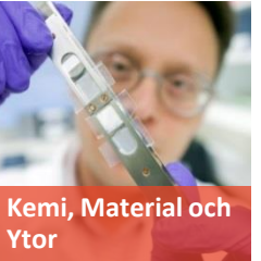
Kemi, Material och Ytor