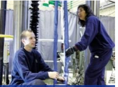
Bygg och Mekanik