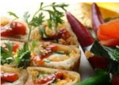
Livsmedel och Bioteknik