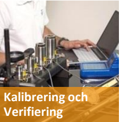
Kalibrering och Verifiering