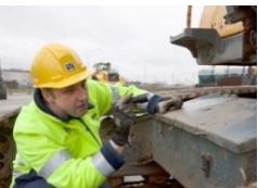
Maskinprovning och Besiktning