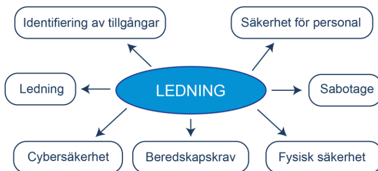
Figur 3. Det integrerade ramverket för områden där en riskhanteringsplan behövs

Ramverket identifierar sju prioriterade områden där en riskhanteringsplan behövs: (1) ledning, (2) identifiering av tillgångar, (3) säkerhet för personal, (4) cybersäkerhet, (5) fysisk säkerhet, (6) sabotage och (7) beredskapskrav. Det finns ett ömsesidigt beroende mellan de olika delarna: en sårbarhet i ett område kan påverka en annan, och därför förespråkas en holistisk syn. Ramverket presenteras översiktligt i Figur 3.