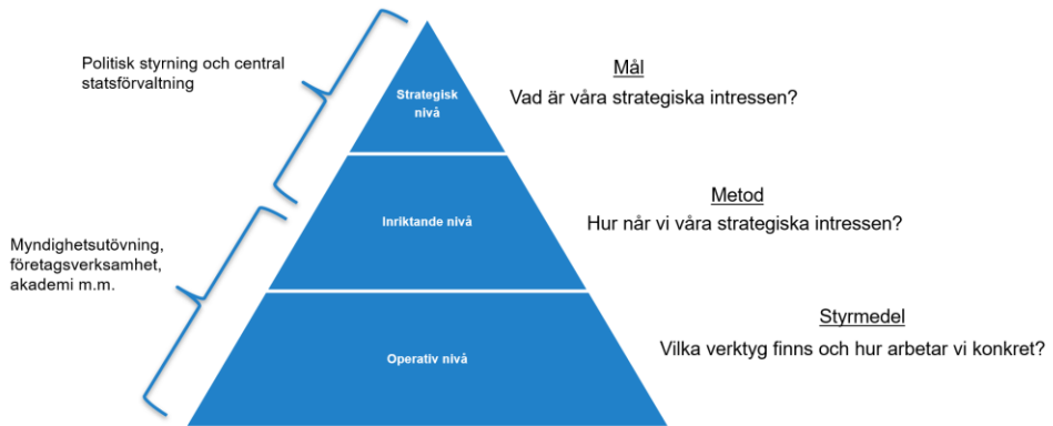
Figur 1. Strukturen för det strategiska ramverket.

Nedan, i Figur 1, illustreras de olika nivåerna och hur de kan ses tillsammans.